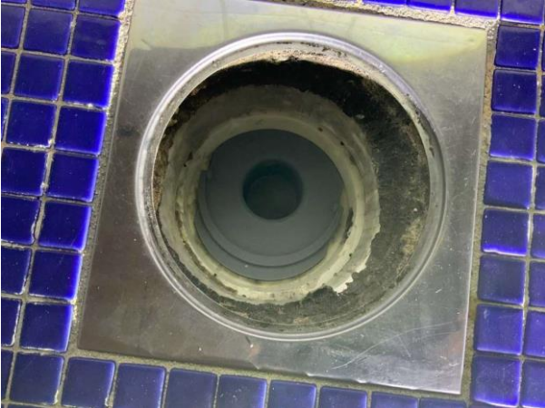
Bild 13: Invändigt, Övervåning, Badrum, Äldre våtrum Golvbrunnen är väggnära placerad Klämring saknas i golvbrunnen/brunnsduk är dragen över golvbrunnen