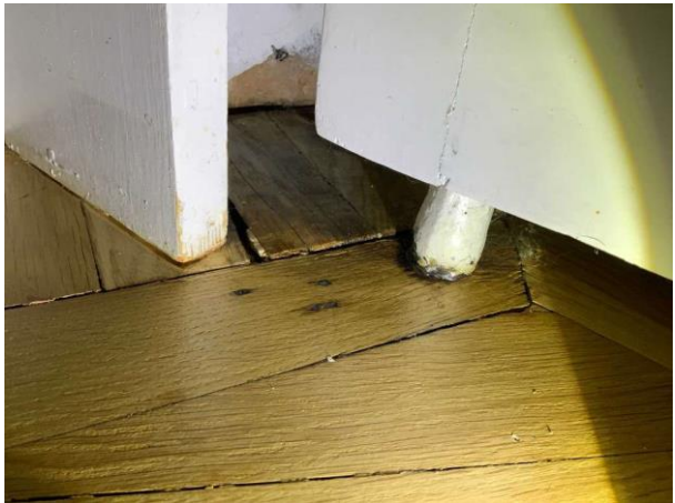
Bild 12: Invändigt, Entréplan, Salong, Skada i parkett vid radiator (torrt vid besiktning)