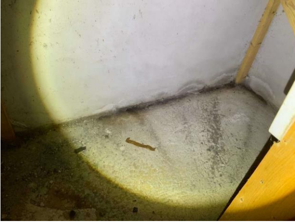
Bild 7: Invändigt, Källarplan, Utrymme under trappa, Fuktgenomslag och mikrobiell påväxt i golv/väggvinkel