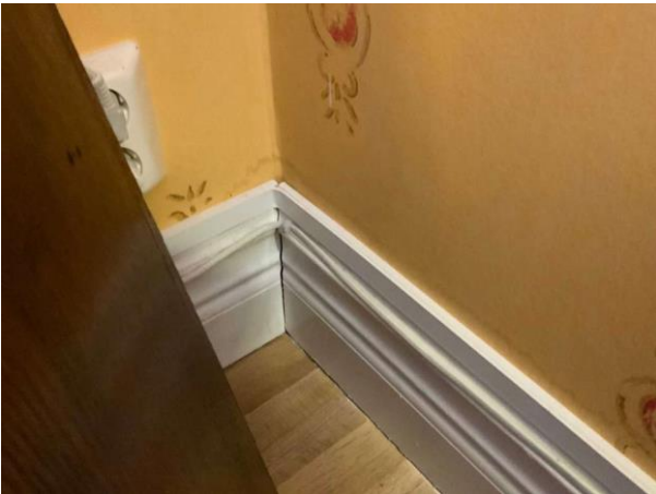
Bild 11: Invändigt, Entréplan, Matsal, Fuktmärke i tapet (torrt vid besiktning)