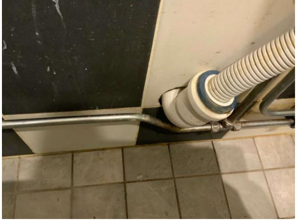
Bild 8: Invändigt, Källarplan, Duschrum, Kvalitetsdokumentation saknas Dusch nära dörröppning Rör i vägg noterades i duschzonen Brunnsduken är synlig under klämringen Golvbrunnens...