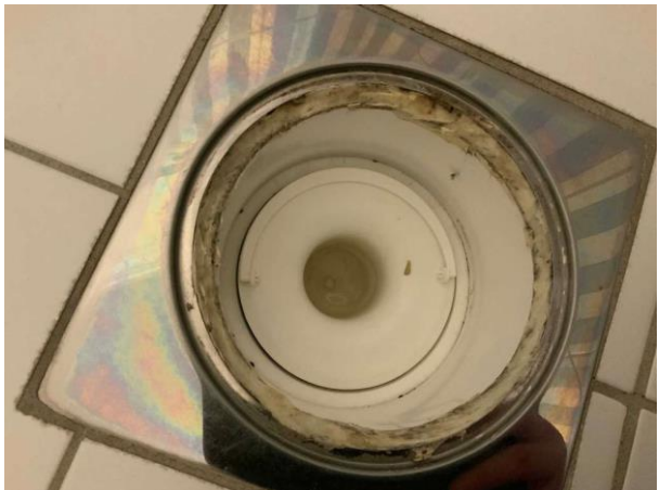
Bild 16: Invändigt, Övervåning, Duschrum, Äldre våtrum Klämring saknas i golvbrunnen Se riskanalysen