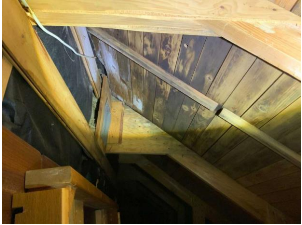
Bild 8: Invändigt, Övervåning, Kattvind 1, Mikrobiell påväxt noterades på underlagstaket Luftningen mot underlagstaket är igensatt Se riskanalys vind