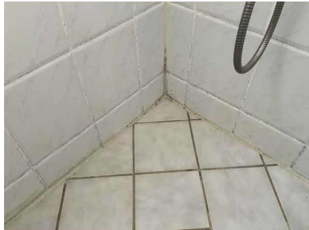
Bild 4: Invändigt, Entréplan, Duschrum/tvättstuga, Äldre våtrum se riskanalysen Missfärgningar/mögel i mjukfogar Fönster i duschzon (täckt med skiva) Det förekommer rörgenomföringar i golv an...