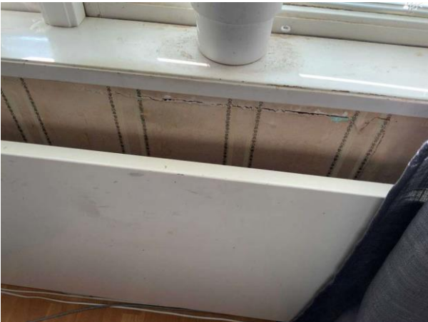
Bild 3: Invändigt, Entréplan, Sovrum 1, Spricka i vägg under fönster