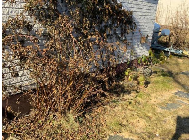
Bild 2: Utvändigt, Mark, Lokala marksättningar noterades Kondensvatten från värmepumpen avslutas vid grunden Dagvatten avslutas vid grunden (hobbyrum) Buskar runt hu...