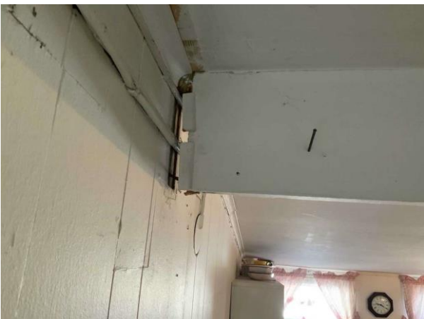
Bild 5: Invändigt, Entréplan, Hobbyrum, Balk har gått isär i taket Det noterades avvikande lukt Sättning noterades i golvet mot ytterväggen Se fortsatt teknisk utredning