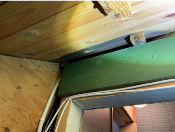
Bild 9: Invändigt, Övervåning, Kattvind 1, Mikrobiell påväxt noterades på underlagstaket Luftningen mot underlagstaket är igensatt Äldre läckage vid takfönster Frost på underlagstaket...