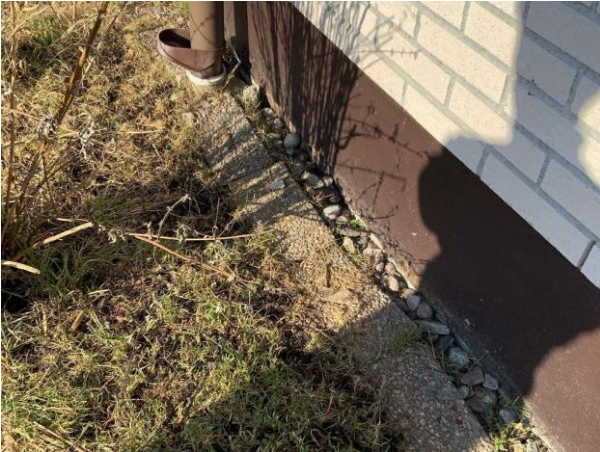
Bild 1: Utvändigt, Mark, Lokala marksättningar noterades Kondensvatten från värmepumpen avslutas vid grunden Dagvatten avslutas vid grunden (hobbyrum) Buskar runt hu...