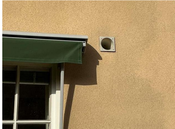
Bild 2: - Utvändigt, Fasad, Puts -s.k enstegstätad putsfasad har visat sig vara känsliga för fukt se riskanalysen Lokal rötsk...