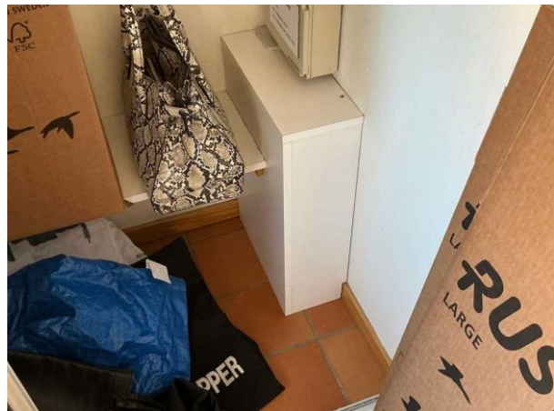
Bild 6: - Invändigt, Entréplan, Skåp med golvvärmslingor igenbyggt med hylla Lokalt bom i några plattor