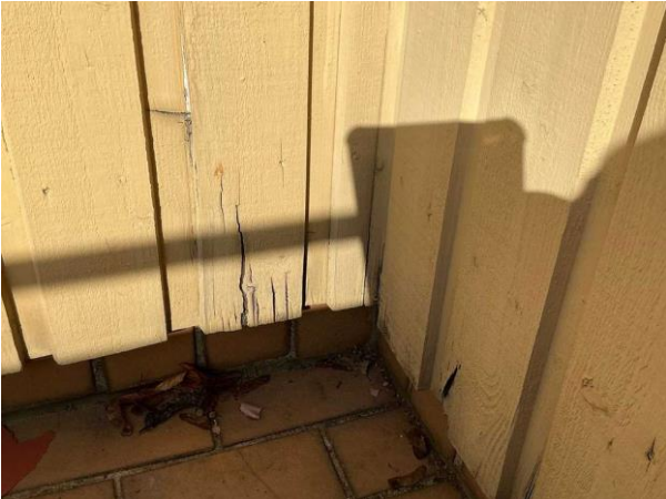
Bild 1: - Utvändigt, Fasad, Puts -s.k enstegstätad putsfasad har visat sig vara känsliga för fukt se riskanalysen Lokal rötsk...