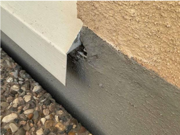
Bild 3: Utvändigt, Ytterdörr, Otätt vid tröskelbleck på altandörr